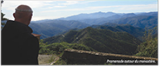
Paysage autour du monastère.

« En effet, j'ai été partie de notre monastère Saint-Carthaire de Sarron de Tignes le 14 décembre 2021, et le monastère a été fondé et plusieurs années se sont écoulées depuis. »